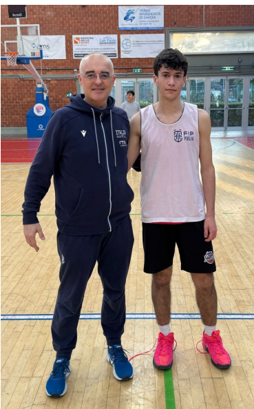
LIONS PROTAGONISTI DELL'EVENTO "OGNI REGIONE CONTA"

imposti al PalaCosmai sia sull'Atletica Andria (88-60) che su San Giovanni Rotondo (99-64) confermando tutto il loro valore. Prossima gara lunedì 10 marzo, alle ore 18:15, sul campo della palestra "Fieramosca", domicilio della Nuova Cestistica Barletta mentre sette giorni più tardi, lunedì 17, è in programma la sfida interna con la Virtus Foggia. Forza ragazzi!